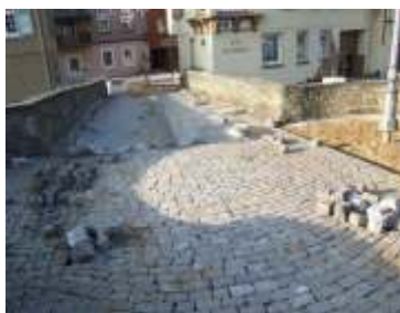
Die Pflastererneuerung der alten Brücke ist fertig. Gut geworden!

Wer zur Zeit durch unsere Stadt geht, nimmt wahr, dass sich im tatsächlichen Sinne viel bewegt. Die Stadt zeigt sich in ihrem 850. Jahr von siner dynamischen Seite. Überall erneuert sich ihr Bild, ohne dass das vertraute und traditionelle verfälscht wird.