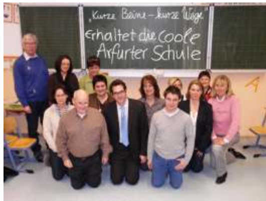
Vertreter der Arfurter Räte stellen sich in die Solidarität mit den kurzen Beinen

In diesem von durchsichtigen Interessen gesteuerten Fahrplan sollten nun auch noch