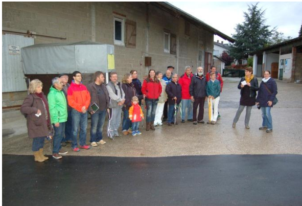
Rund 20 Teilnehmerinnen und Teilnehmer beteiligten sich am Rundgang durch den Stadtteil.