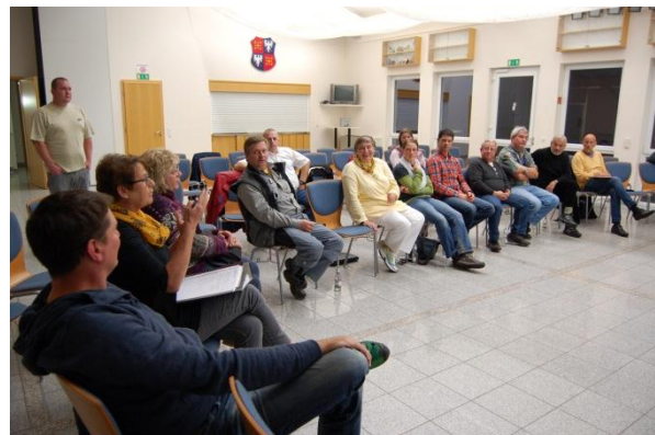
Beim anschließenden Workshop beteiligten sich die Bürgerinnen und Bürger sehr rege an der Diskussion.