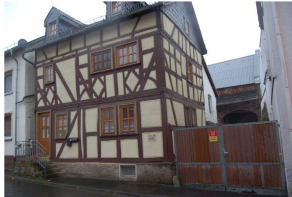
Die künftige Nutzung als Vereinshaus des historischen Fachwerkhouses in der Mittelstraße (städtischer Besitz) wurde diskutiert.