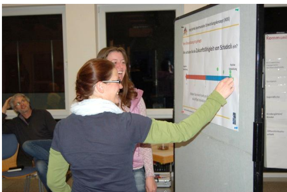
Die Teilnehmerinnen und Teilnehmer bewerten die Zukunftsfähigkeit ihres Stadtteils.