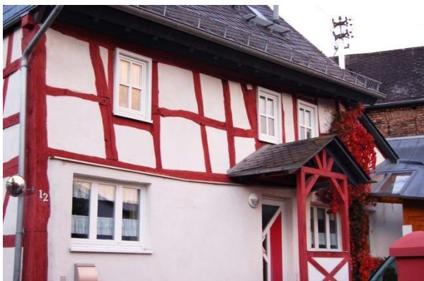
Es gibt positive Beispiele für Sanierungsmaßnahmen im Ortskern.