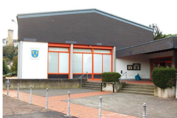
Das Bürgerhaus wird rege genutzt, es besteht allerdings Sanierungsbedarf.