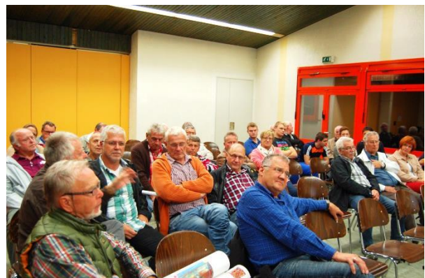
Während des Workshops wurden Stärken, Schwächen und Projektideen für den Stadtteil diskutiert.