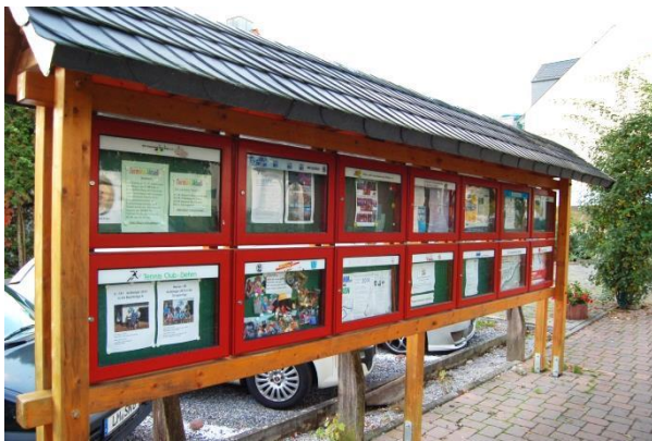
Die Info-Kästen wurden ebenfalls im Rahmen der Aufwertung des Dorfplatzes errichtet.