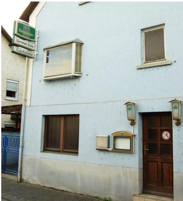
Leerstand einer ehemaligen Gaststätte in der Burgfriedenstraße.