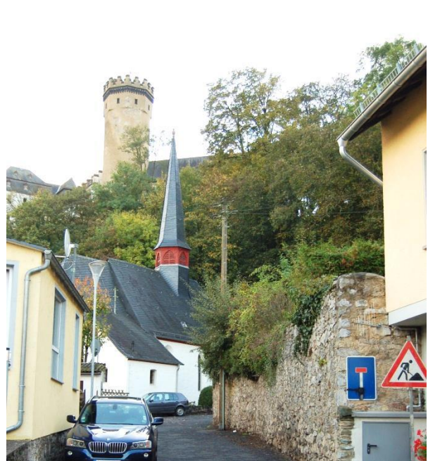
Der Blick auf die Kapelle und das Schloss Dehrn.