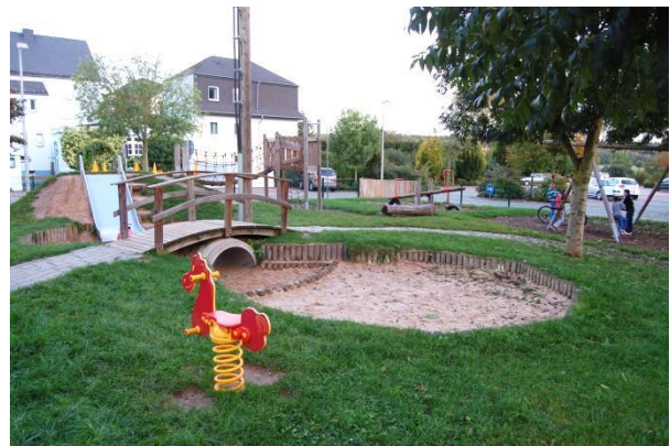
Am Dorfplatz wurde auch ein Spielplatz neu angelegt.