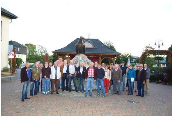
Der Dorfplatz mit Brunnen wurde in großer Eigenleistung der Bevölkerung hergerichtet.