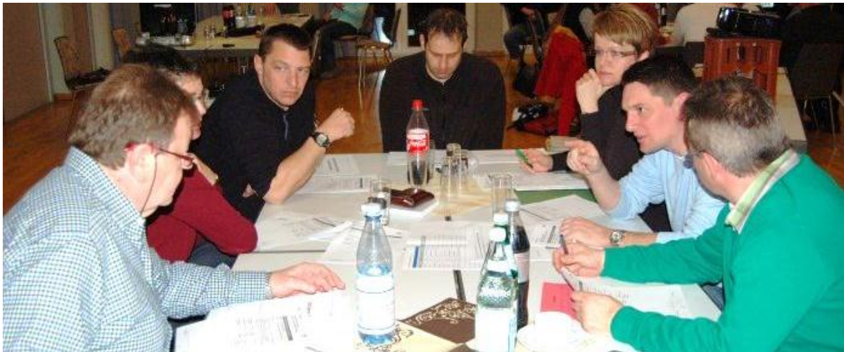
AG Technische Infrastruktur, Wirtschaft und Bildung